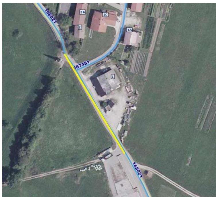
Slika 2: Območje obdelave sklopa obnova JP 667 441