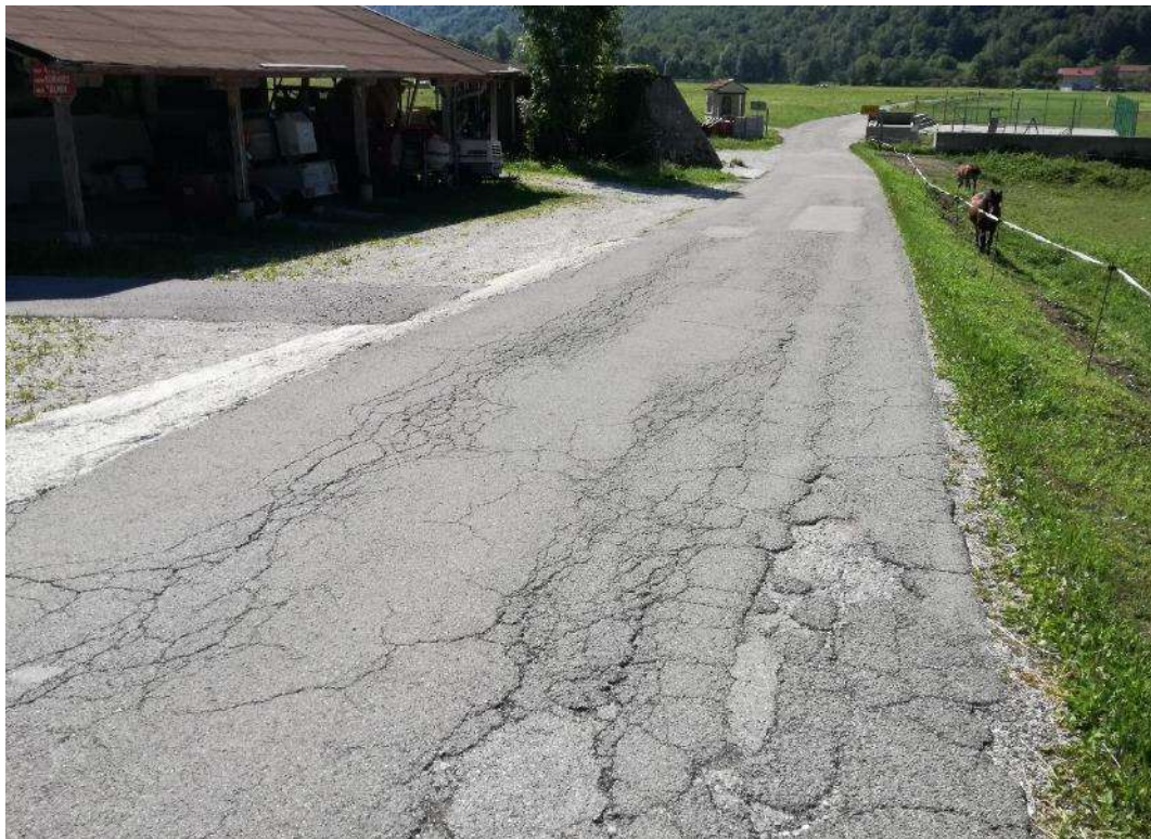
Slika 3: Značilno stanje obstoječega vozizšča

Opravili smo terenski ogled voziščne konstrukcije predvidnih območij urejanja. Cesta poteka po naselju. Voziščna konstrukcija v slabem stanju. Voziščna površina je razpokana. Količina razpok se veča s prehajanjem proti robovom vozišča. Razpokanost je večja kjer se voda izteka pod samo voziščno konstrukcijo. Odvodnjavanje je urejene kot prelivanje s prečnim in vzdolžnim sklonom na okoliška tla. Na začetku obravnavanega območja se nahaja jašek z betonskim perforiranim pokrovom.